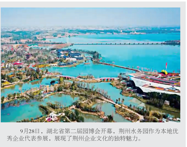
9月28日，湖北省第二届园博会开幕，荆州水务园作为本地优秀企业代表参展，展现了荆州企业文化的独特魅力。

推动工作”作为问题整改的出发点和落脚点，制定了《荆州水务集团“不忘初心 牢记使命”主题教育活动问卷调查表》，并发放至各窗口部门。与此同时，坚持以“水厂开放日”用户座谈会、行风热线、用户意见箱等多种渠道，广泛征求各界用户对供水服务工作的意见，深刻检视反思，及时反馈。